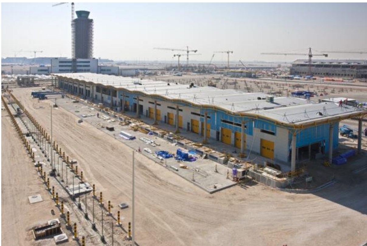
Cargo Agent Building and Air Traffic Control Tower under Construction. (Initial Stage)