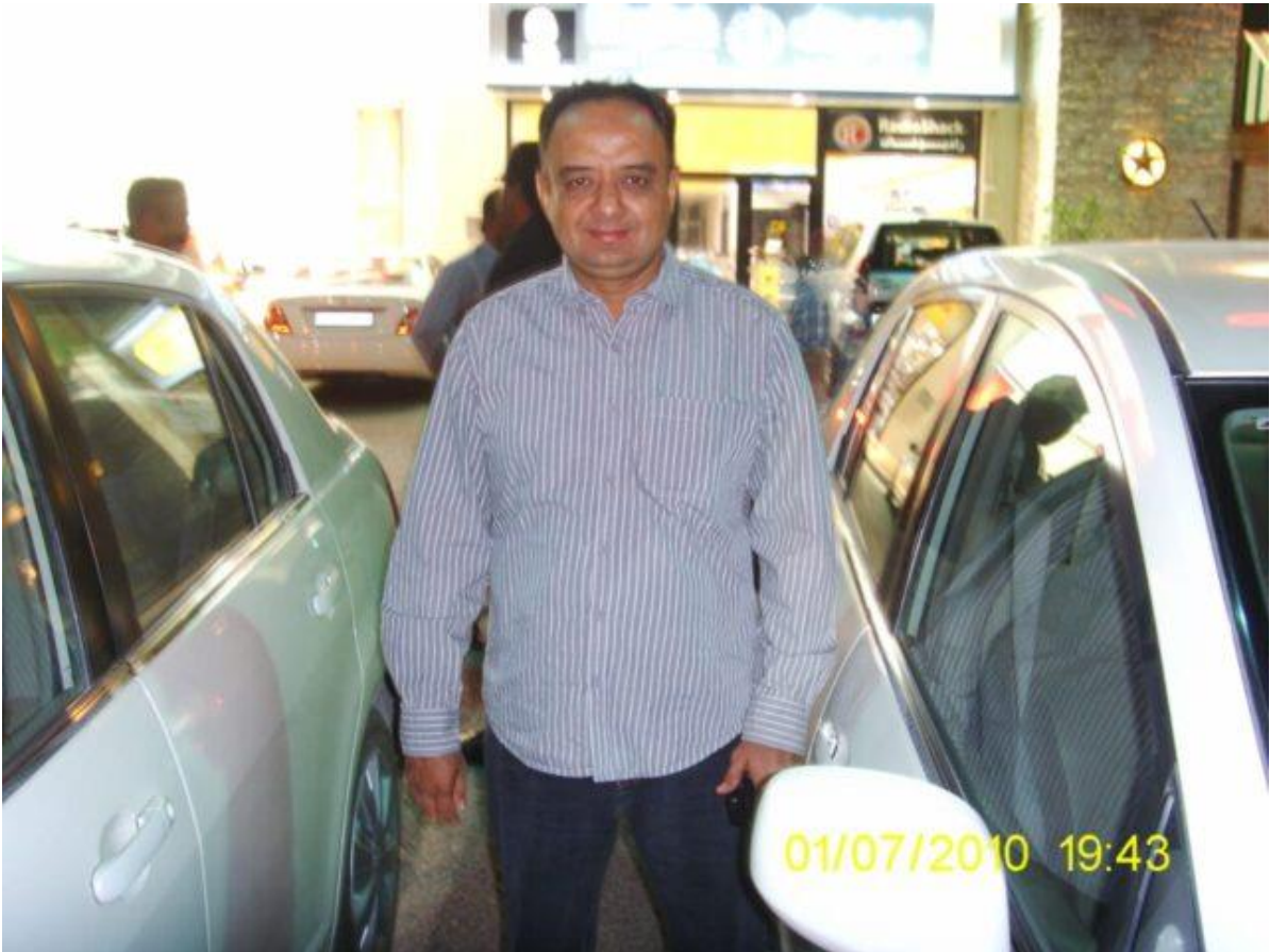
Nasirhusen (Dinner Time)