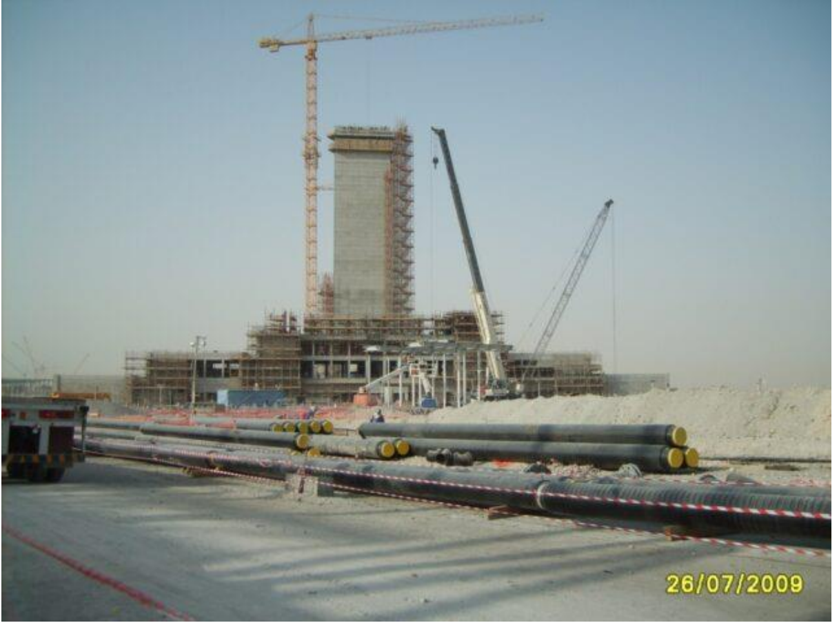
Air Traffic Control Tower. Initial Construction stage.

એર ટ્રાફિક કંટ્રોલ ટાવર. બાંધકામનો પ્રારંભિક તબક્કો.