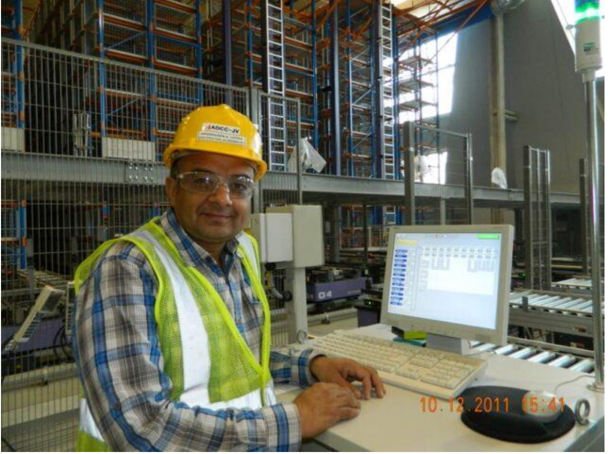
Doha (Qatar) Cargo Terminal: airside to landside and landside to airside - "Automated Control"

દોહા (કતાર) કાર્ગો ટર્મિનલ: એરસાઇડથી લેન્ડસાઇડ અને લેન્ડસાઇડથી એરસાઇડ - "ઓટોમેટેડ કંટ્રોલ"