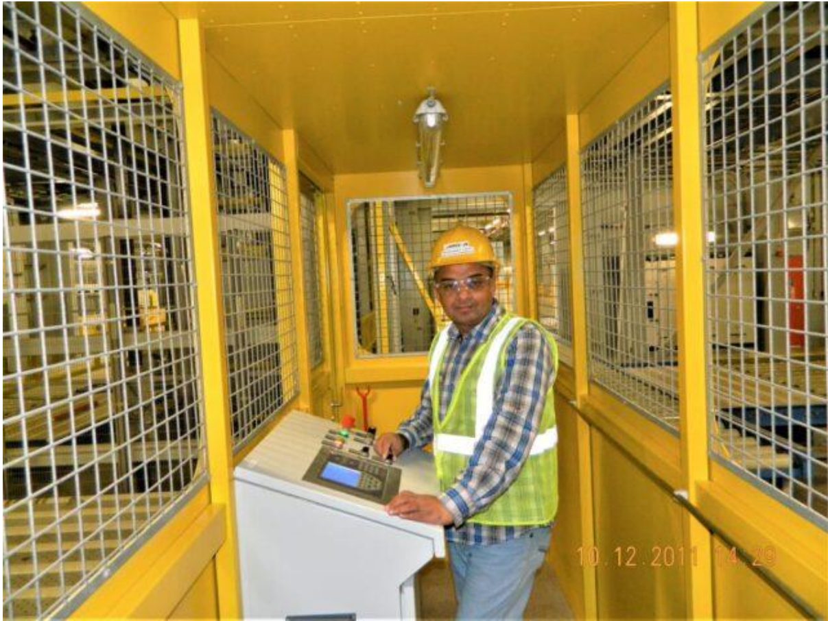
Doha (Qatar) Cargo Terminal: airside to landside and landside to airside - "Automated Control"