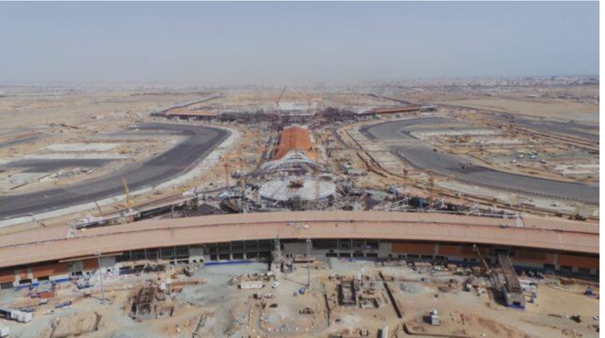
કિંગ અબ્દુલઅઝીઝ ઇન્ટરનેશનલ એરપોર્ટ - જુદાહ (સાઉદી અરેબિયા) King Abdulaziz International Airport - Jeddah (Saudi Arabia) - Passenger Terminal