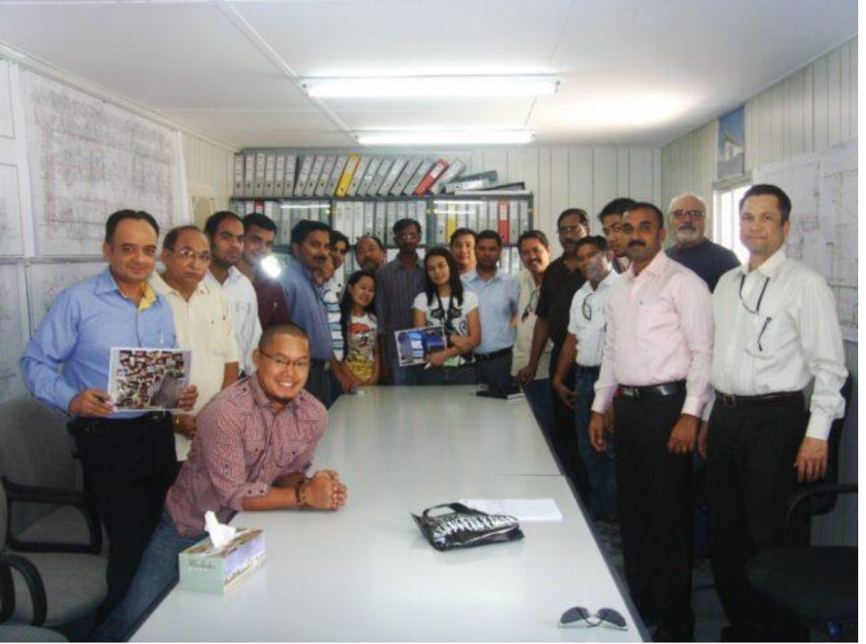
Best Farewell Party by Colleagues at New Doha International Airport (NDIA), Doha, Qatar)

ન્યુ દોહા ઇન્ટરનેશનલ એરપોર્ટ (NDIA), દોહા, કતાર ખાતે સાથીદારો દ્વારા શ્રેષ્ઠ ફેરવેલ (વિદાય) પાર્ટી.