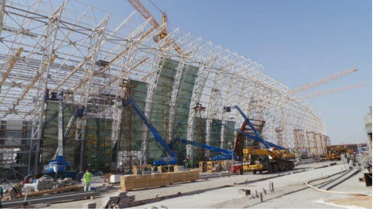
King Abdulaziz International Airport - Jeddah (Saudi Arabia) - Passenger Terminal કિંગ અબ્દુલઅઝીઝ આંતરરાષ્ટ્રીય વિમાનમથક - જેદાહ (સાઉદી અરેબિયા) - પેસેન્જર ટર્મિનલ