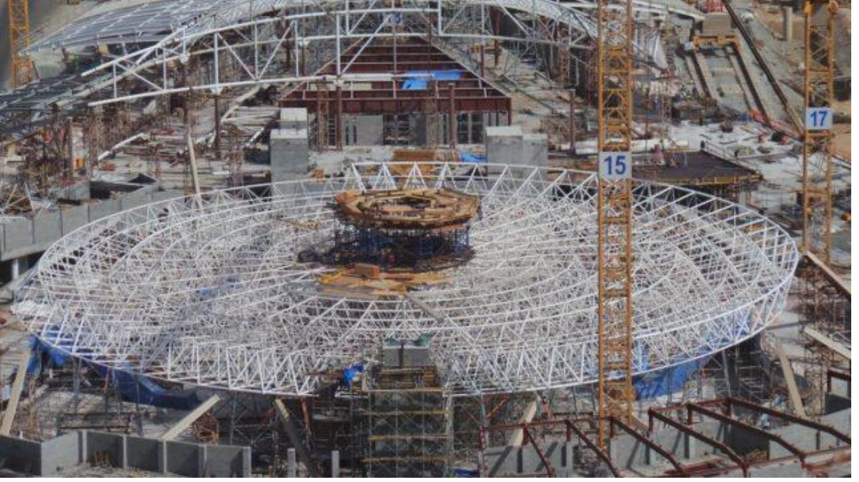
કિંગ અબ્દુલઅઝીઝ ઇન્ટરનેશનલ એરપોર્ટ - જુદાહ (સાઉદી અરેબિયા) - પેસેન્જર ટર્મિનલ King Abdulaziz International Airport - Jeddah (Saudi Arabia) - Passenger Terminal