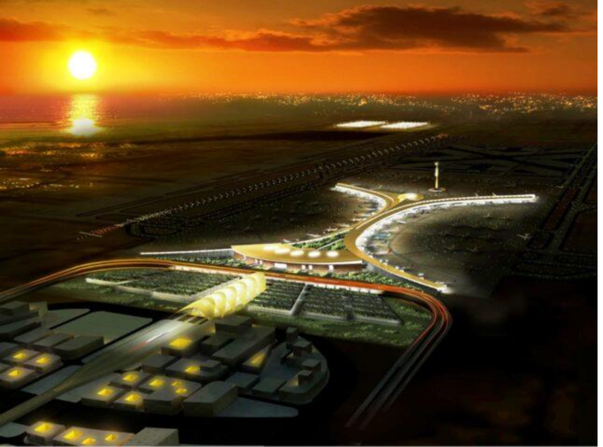
King Abdulaziz International Airport - Jeddah (Saudi Arabia). જીદ્દાહ નું નવું બનેલું Passenger Terminal

PDF ફાઇલો ડાઉનલોડ કરવા માટે ઉપર આપેલી (1) અને (2) લિંકો પર ક્લિક કરો.