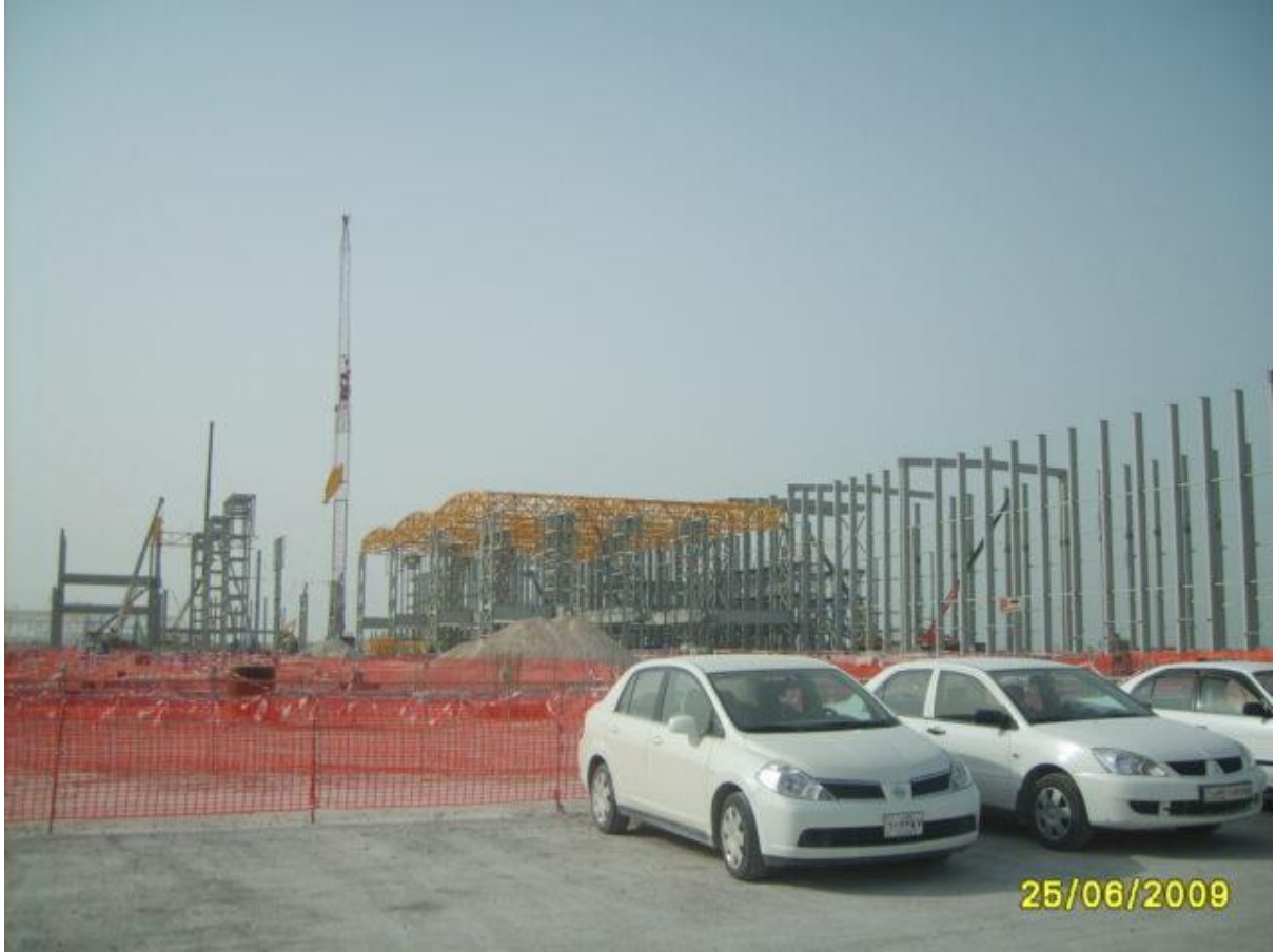
Cargo Terminal Assignment Area Initial construction stage કાર્ગો ટર્મિનલ Assignment Area પ્રારંભિક બાંધકામ તબક્કો